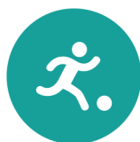
Spel en beweging/ bewegingsonderwijs